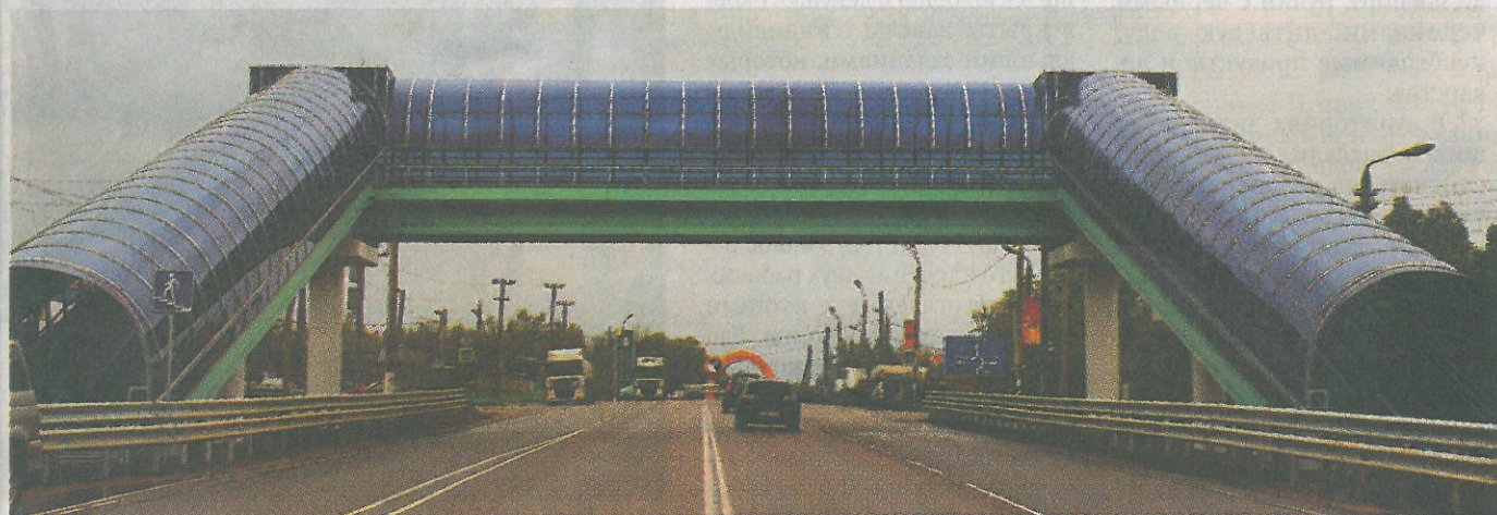
Две стороны скоростной магистрали связал современный переход

П ешеходный переход с наклонными подъемниками появился недавно в поселке Иншинском.